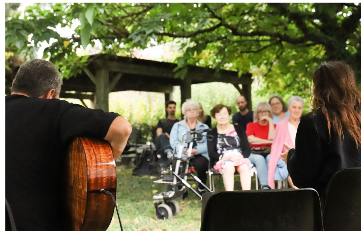
Création participative d'Utpown Lovers à l'EHPAD Louise Coucheroux, Ecully, 2023

L'édition 2023 a débuté le 19 juillet avec 17 concerts sur le territoire de la Métropole de Lyon donnés par 39 artistes issus de cette dernière ; ainsi qu'un programme de cinq créations participatives et des concerts en région Auvergne-Rhône-Alpes en partenariat avec les acteurs de notre filière régionale.