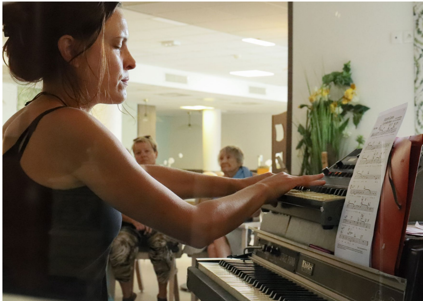
Watchdog à l'EHPAD Dethel, Tassin-la-Demin-Lune, 2023