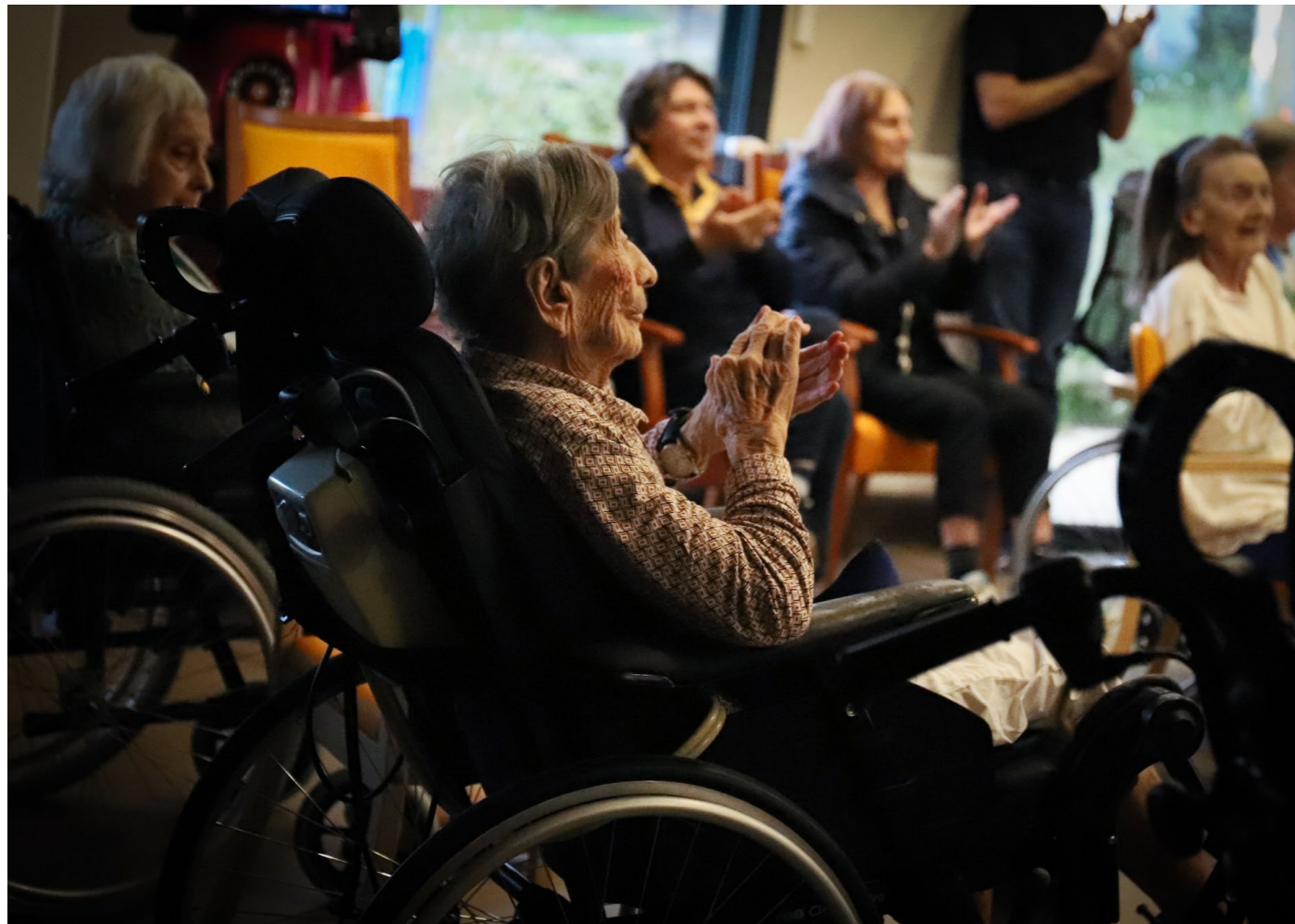
Création participative de Cube à l'EHPAD du CH de Sainte-Foy-Lès-Lyon, 2023