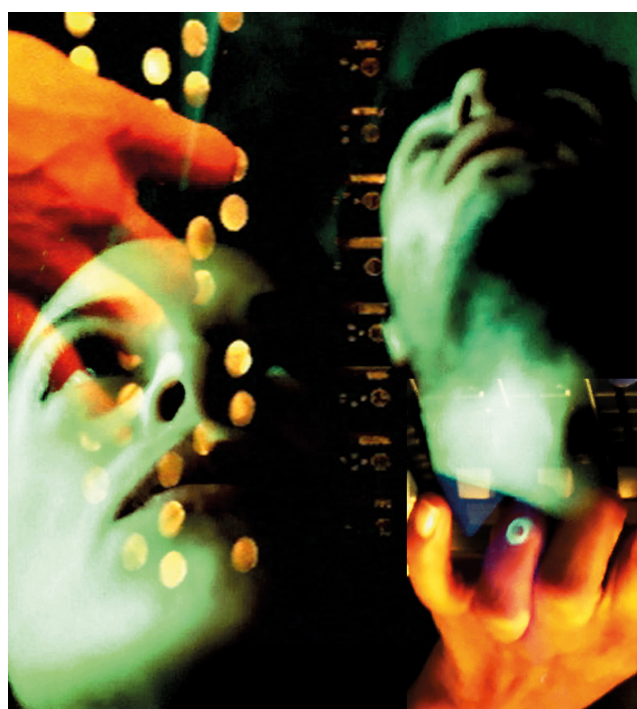
« Odalisque » A. Poujola, J.Myslikovjan • Chantier 2017/2018