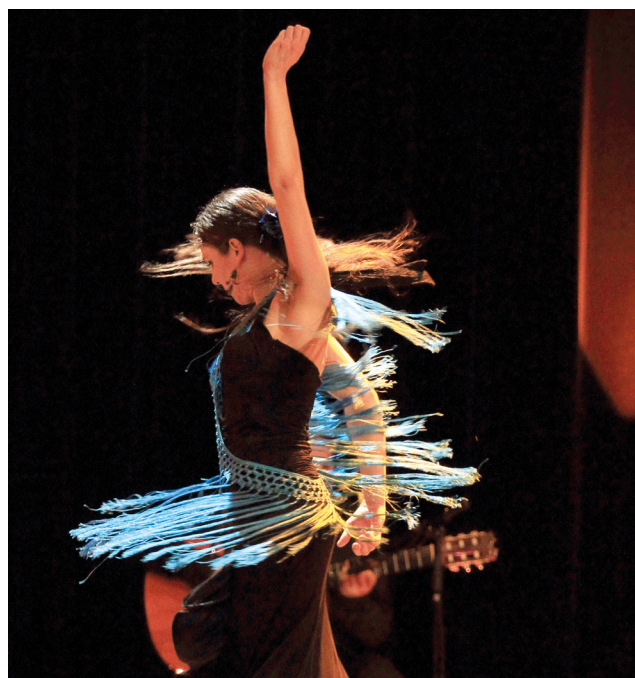
« Chaos » Marie Gache ■ Chantier 2016/2017